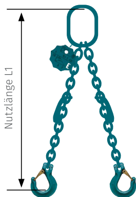
Gabelkopfhaken 01 - GH

mit Standardaufhängekopf, mit Verkürzungsklaue