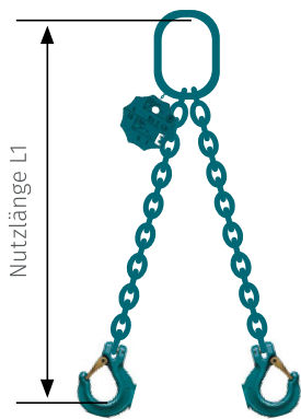
Gabelkopfhaken 01 - GH

mit Standardaufhängekopf, ohne Verkürzungsklauen